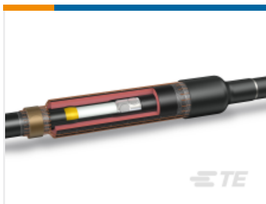
TE 产品编号E67139-069 POLJ-24/1X120-240