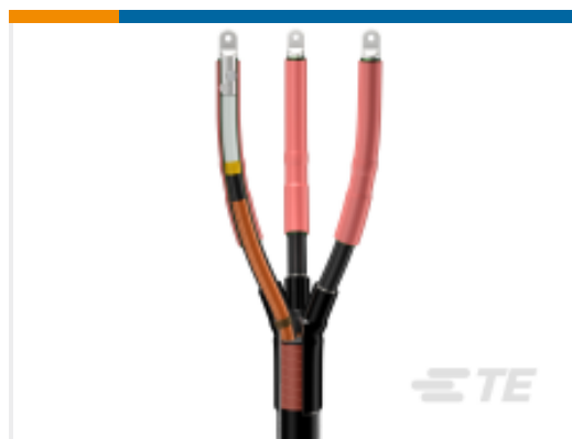
TE 产品编号E92435-063 POLT-12D/3XIH1