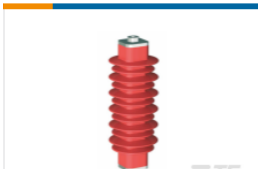
TE 产品编号EN6028-000 HDA-33M-B3-NFF