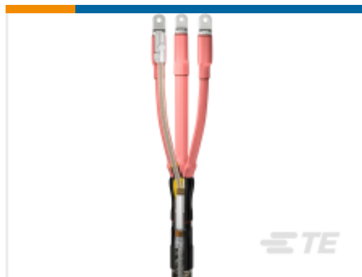
TE 产品编号A31452-070 GUST-12/70-120/800-L12