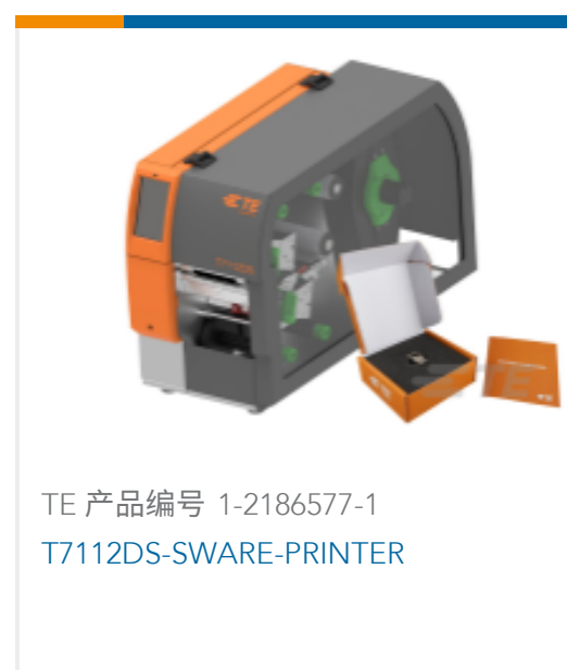
TE 产品编号 1-2186577-1 T7112DS-SWARE-PRINTER