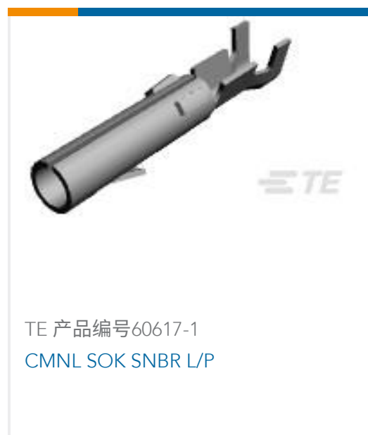
TE 产品编号60617-1 CMNL SOK SNBR L/P