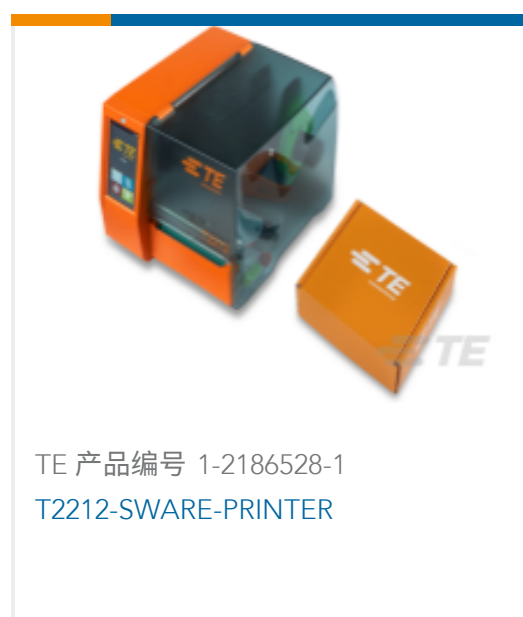
TE 产品编号 1-2186528-1 T2212-SWARE-PRINTER