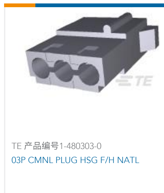
TE 产品编号1-480303-0 03P CMNL PLUG HSG F/H NATL