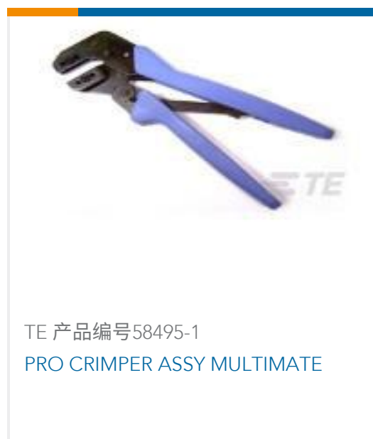
TE 产品编号58495-1 PRO CRIMPER ASSY MULTIMATE