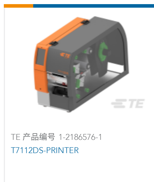
TE 产品编号 1-2186576-1 T7112DS-PRINTER