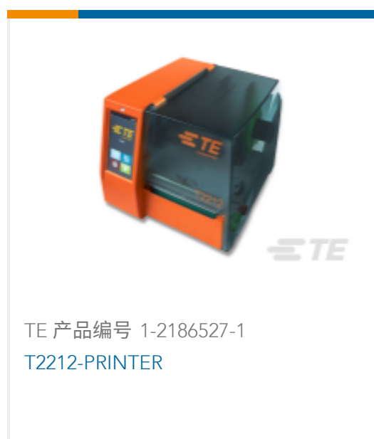
TE 产品编号 1-2186527-1 T2212-PRINTER