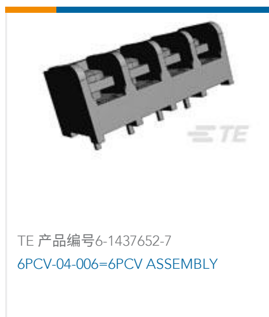
TE 产品编号6-1437652-7 6PCV-04-006=6PCV ASSEMBLY