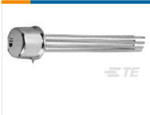
TE 产品编号1-1617351-0 JMACDG-18XP=M39016/15-092P