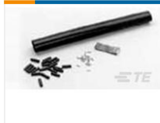
TE 产品编号426913-000 LNCL-13-305-GK