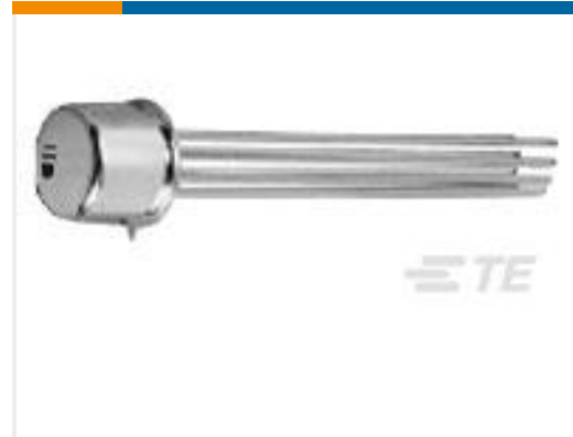
TE 产品编号1617165-1 JMAWDD-12XP = M39016/20-010P