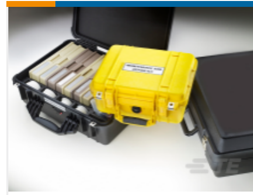
TE 产品编号A12306-000 MK-0020-105-DATABUS