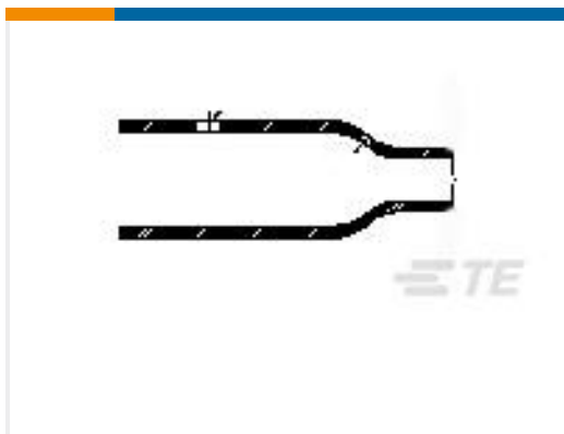
TE 产品编号813681-000 208A086-3-0