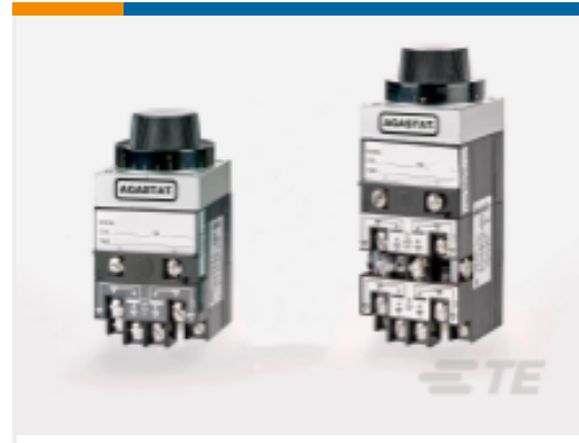
TE 产品编号1423183-7 7032CDD=RLY,STD,DBH,2P,480VAC