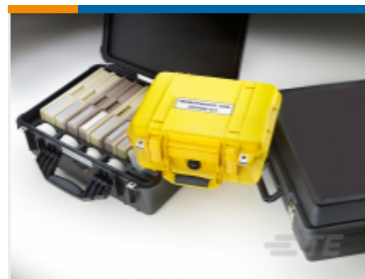
TE 产品编号312053-000 HRM/01-2117