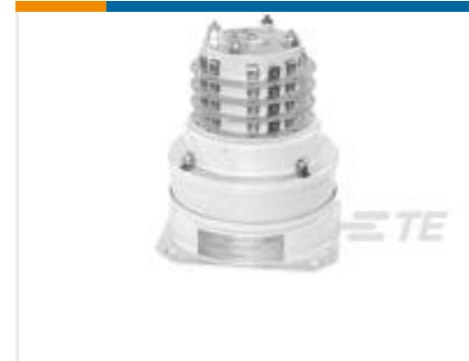
TE 产品编号1-1393139-9 MDR-170-2=MDR