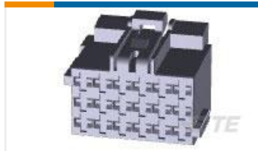
TE 产品编号1-965640-3 JUN-POW-TIM GEH 6P