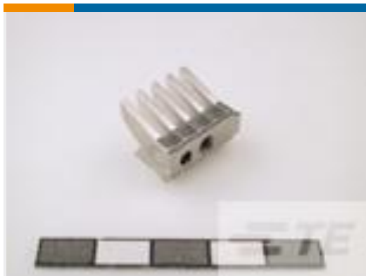
TE 产品编号3-547873-0 SPECIAL JAW 1