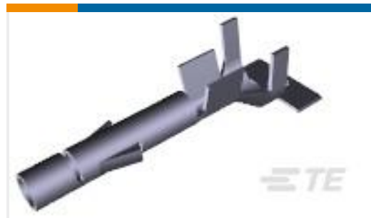
TE 产品编号926869-1 UNIV.M-N-L.SOCKET