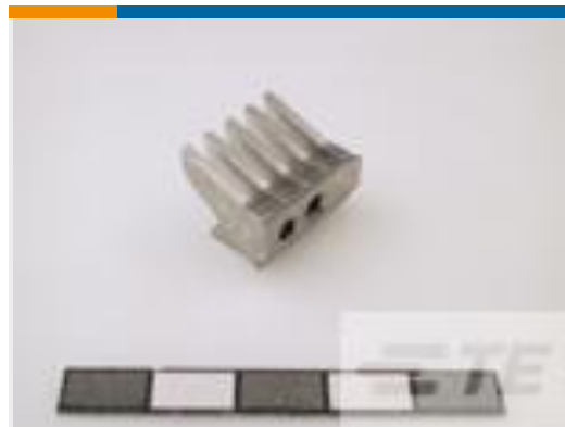
TE 产品编号3-547873-1 SPECIAL JAW 2