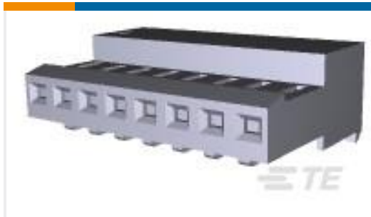
TE 产品编号3-640441-8 08P MTA100 CONN ASSY WHT