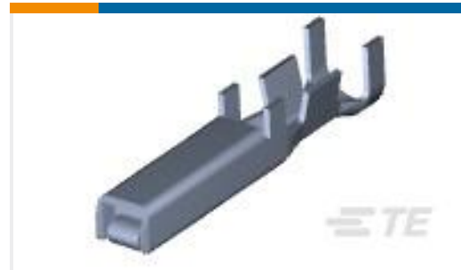
TE 产品编号1-175218-5 DYNAMIC D-3 REC CONT. L PRE-TIN L/P