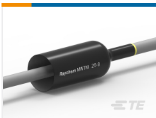
TE 产品编号381522-000 MWTM-25/8-1000/S(S10)