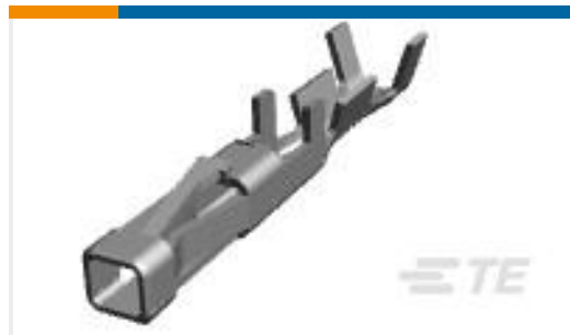
TE 产品编号1-794611-2 MICRO MNL RPT CNT,LS PC,30AU L