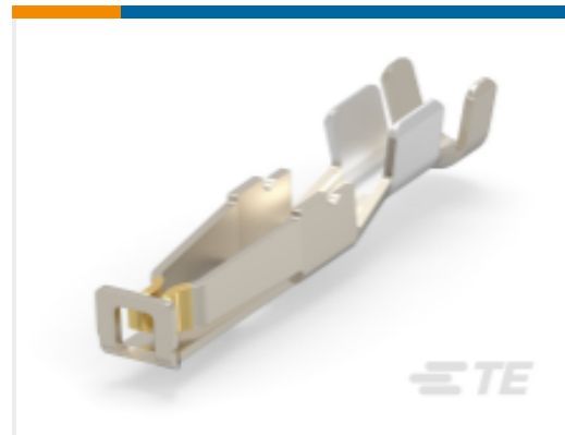
TE 产品编号234064-E STVBTL BUT 100 CSI 2026 207 * J 2 34093