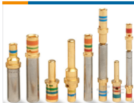
TE 产品编号0660-206-1631L CONT PIN