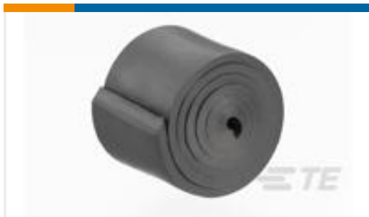
TE 产品编号CS9495-000 SEB-F