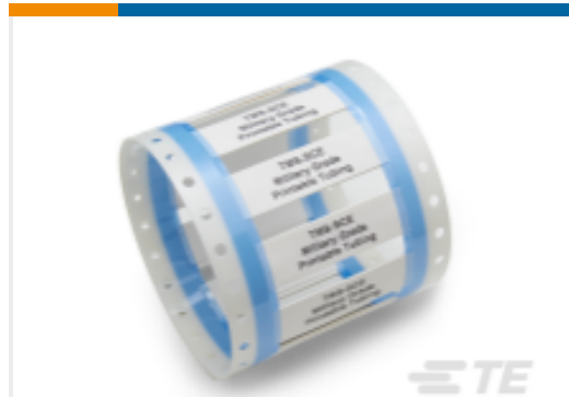
TE 产品编号1099510001 TMS-SCE Military Grade Sleeves