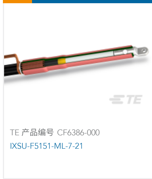
TE 产品编号 CF6386-000 IXSU-F5151-ML-7-21