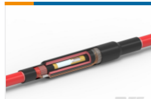
TE 产品编号743209-014 12-42 kV 热缩电缆接头