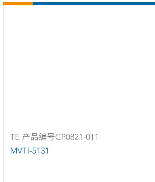
TE 产品编号CP0821-011 MVTI-5131