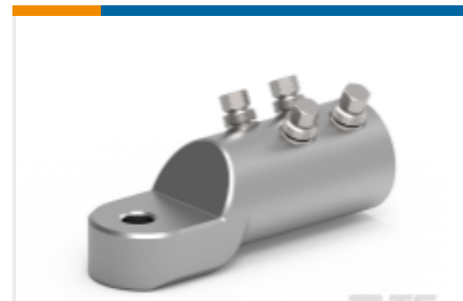
TE 产品编号2832081-1 BLMT-800/1000-17