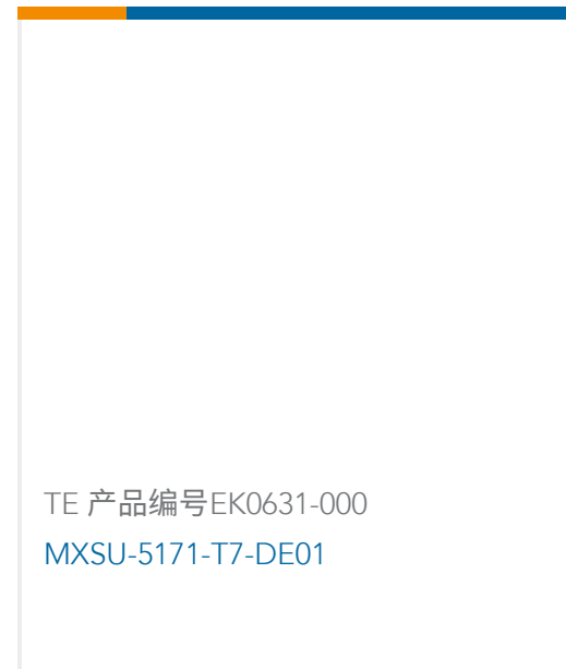
TE 产品编号EK0631-000 MXSU-5171-T7-DE01