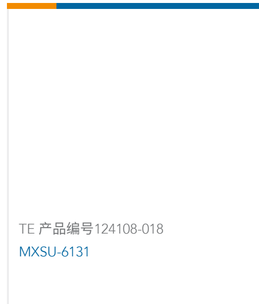
TE 产品编号124108-018 MXSU-6131