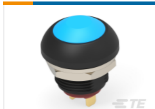
TE 产品编号2-2329383-5 PB ON/OFF FC BLU M1 TERM IP68