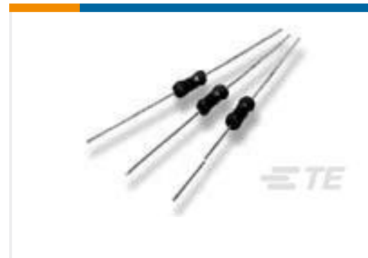
TE 产品编号1-1625893-4 5W SM M/OX 2% 27R