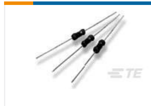
TE 产品编号7-1879350-5 RR01 5% 270R AMMO