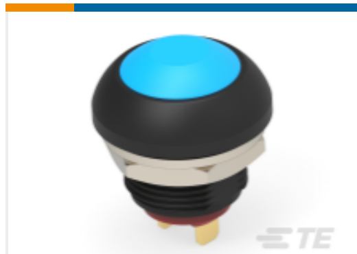
TE 产品编号2-2329383-5 PB ON/OFF FC BLU M1 TERM IP68