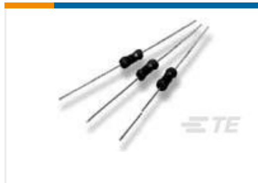
TE 产品编号1-1625893-4 5W SM M/OX 2% 27R