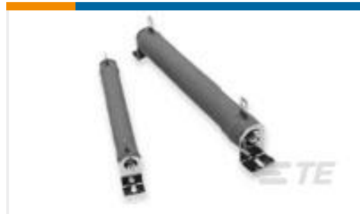
TE 产品编号1-1879447-8 TE 200W 27R 5% Bracket