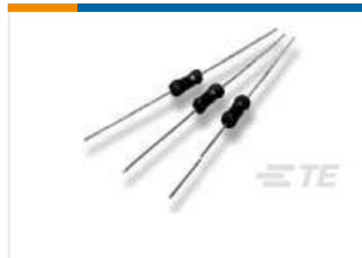
TE 产品编号7-1879350-5 RR01 5% 270R AMMO