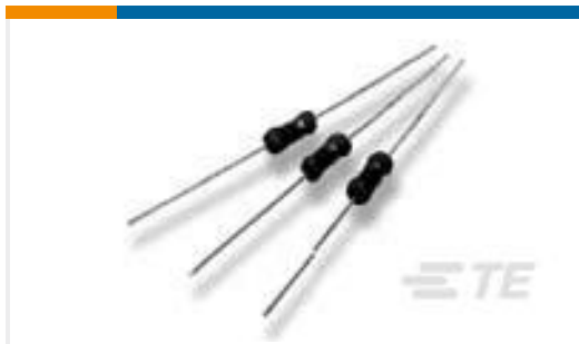
TE 产品编号4-1879355-9 RR03 5% 430K AMMO