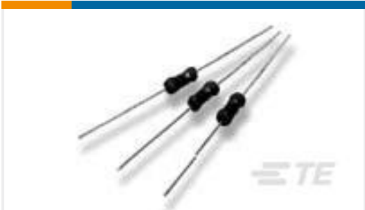
TE 产品编号4-1879355-9 RR03 5% 430K AMMO