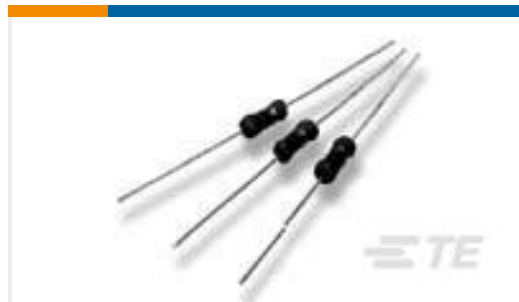
TE 产品编号7-1879350-5 RR01 5% 270R AMMO