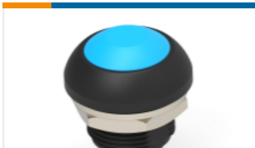
TE 产品编号2-2329383-5 PB ON/OFF FC BLU M1 TERM IP68