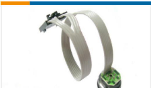
TE 产品编号86-100G-R 100 PSIG RIBBON CABLE MV PRESSURE SENSOR