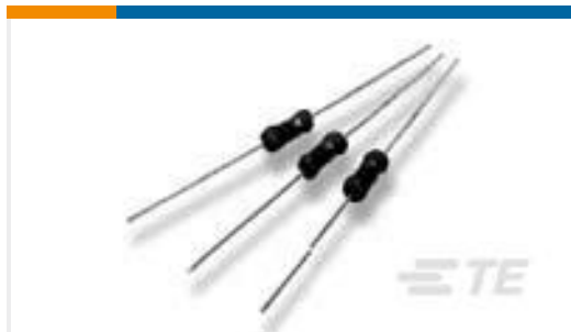
TE 产品编号1-1625893-4 5W SM M/OX 2% 27R