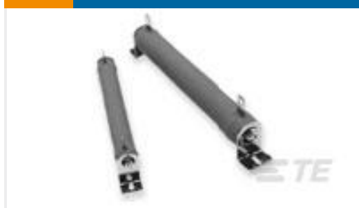
TE 产品编号1-1879447-8 TE 200W 27R 5% Bracket