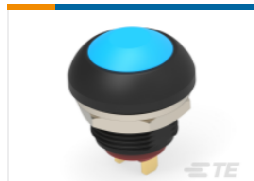
TE 产品编号2-2329383-5 PB ON/OFF FC BLU M1 TERM IP68