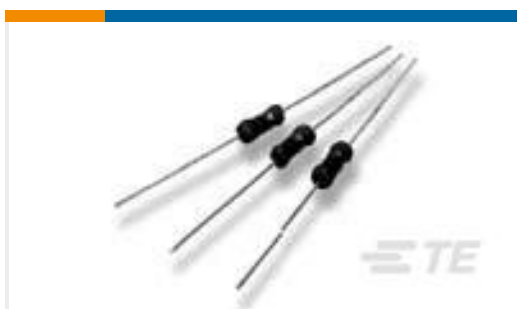
TE 产品编号4-1879355-9 RR03 5% 430K AMMO