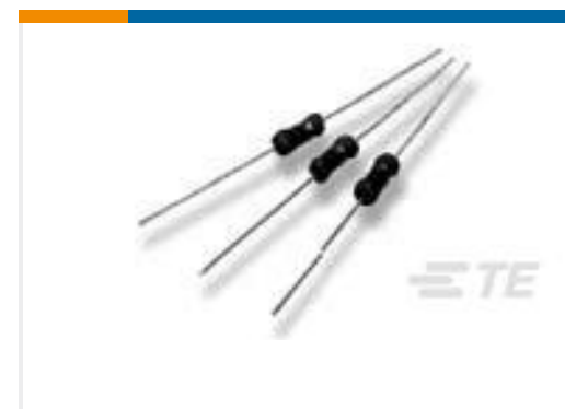
TE 产品编号7-1879350-5 RR01 5% 270R AMMO