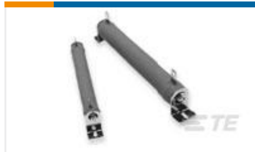
TE 产品编号1-1879447-8 TE 200W 27R 5% Bracket