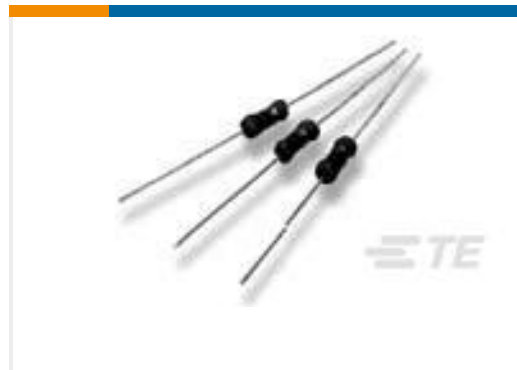
TE 产品编号1-1625893-4 5W SM M/OX 2% 27R