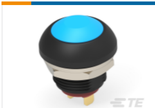
TE 产品编号2-2329383-5 PB ON/OFF FC BLU M1 TERM IP68