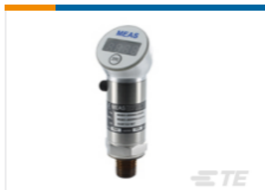
TE 产品编号10214514-00 PRESS XDCR M5842-000005-500PG