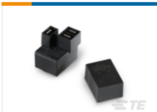
TE 产品编号1558676-1 PCB 功率继电器：30 安培，单稳直流