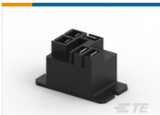
TE 产品编号1-1649341-9 T9CP5A54-120