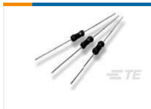
TE 产品编号1-1625893-4 5W SM M/OX 2% 27R