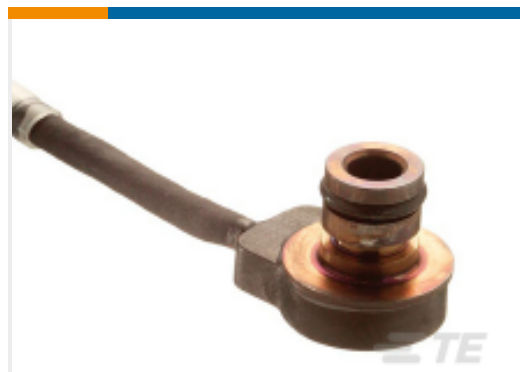
TE 产品编号10201889-00 PRESS XDCR MS1S1-00000J-250PG