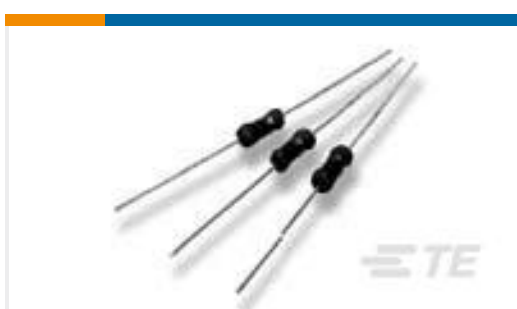
TE 产品编号4-1879355-9 RR03 5% 430K AMMO