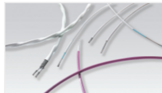
TE 产品编号CJ1465-000 55AC8113-22-9/96-9-9CS2275