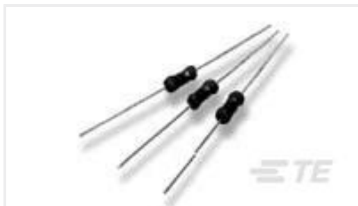
TE 产品编号1-1625893-4 5W SM M/OX 2% 27R