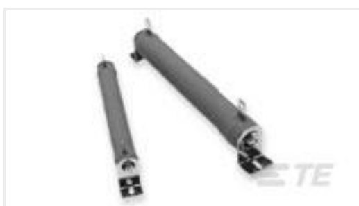
TE 产品编号1-1879447-8 TE 200W 27R 5% Bracket