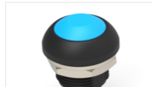
TE 产品编号2-2329383-5 PB ON/OFF FC BLU M1 TERM IP68