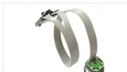
TE 产品编号86-100G-R 100 PSIG RIBBON CABLE MV PRESSURE SENSOR