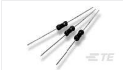
TE 产品编号4-1879355-9 RR03 5% 430K AMMO