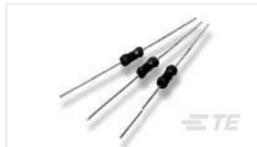
TE 产品编号7-1879350-5 RR01 5% 270R AMMO