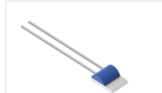
TE 产品编号NB-PTCO-159 Pt100, 2.0x2.3, Class C, PTFC101C1A0