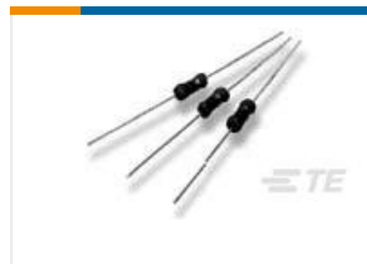
TE 产品编号7-1879350-5 RR01 5% 270R AMMO