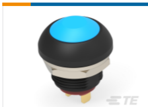
TE 产品编号2-2329383-5 PB ON/OFF FC BLU M1 TERM IP68