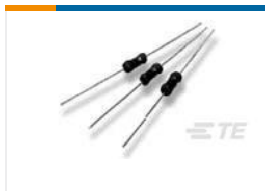
TE 产品编号1-1625893-4 5W SM M/OX 2% 27R