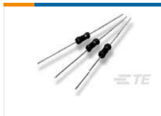
TE 产品编号7-1879350-5 RR01 5% 270R AMMO