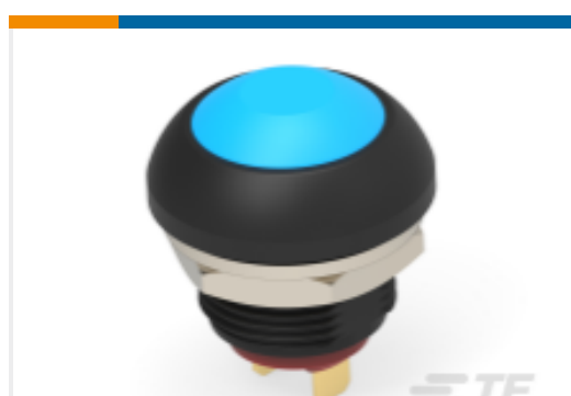
TE 产品编号2-2329383-5 PB ON/OFF FC BLU M1 TERM IP68