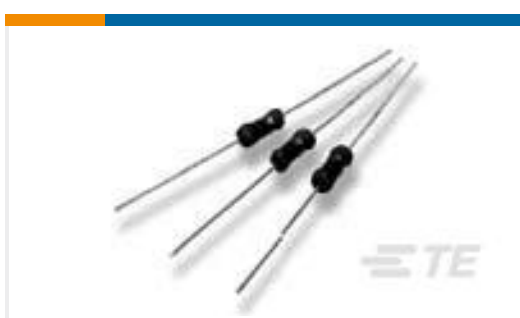
TE 产品编号4-1879355-9 RR03 5% 430K AMMO