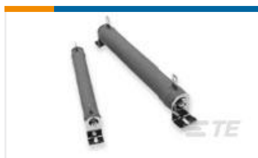
TE 产品编号1-1879447-8 TE 200W 27R 5% Bracket