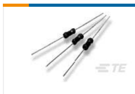
TE 产品编号7-1879350-5 RR01 5% 270R AMMO