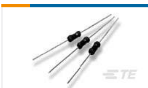
TE 产品编号4-1879355-9 RR03 5% 430K AMMO