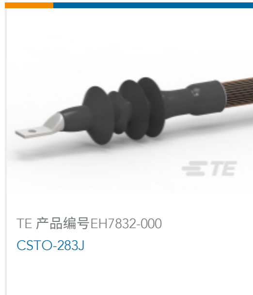
TE 产品编号EH7832-000 CSTO-283J