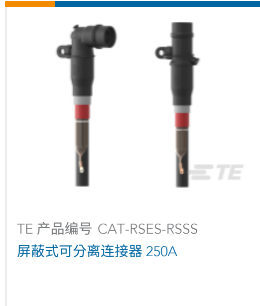
TE 产品编号 CAT-RSES-RSSS 屏蔽式可分离连接器 250A