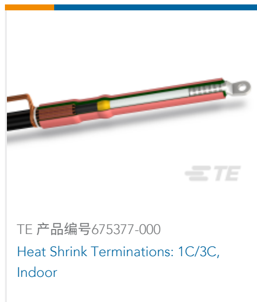
TE 产品编号675377-000 Heat Shrink Terminations: 1C/3C, Indoor