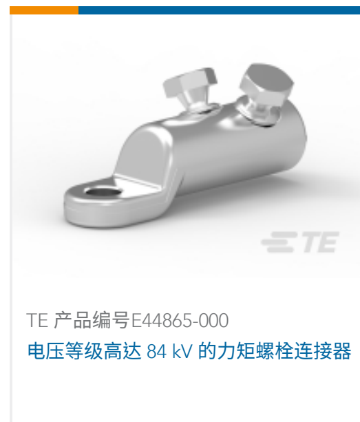
TE 产品编号E44865-000 电压等级高达 84 kV 的力矩螺栓连接器