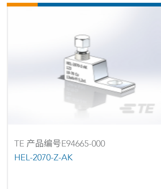
TE 产品编号E94665-000 HEL-2070-Z-AK