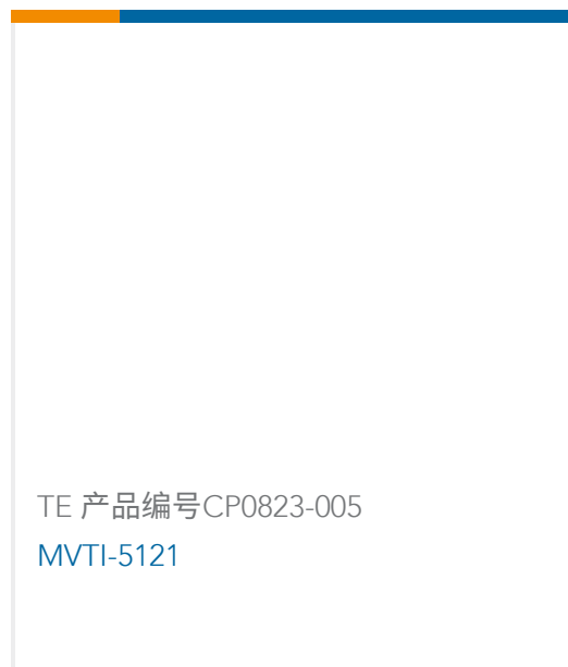
TE 产品编号CP0823-005 MVTI-5121