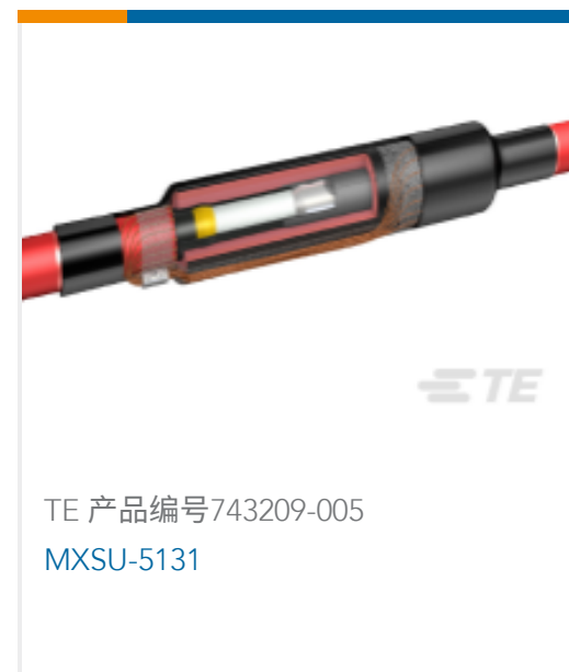
TE 产品编号743209-005 MXSU-5131