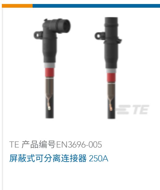
TE 产品编号EN3696-005 屏蔽式可分离连接器 250A