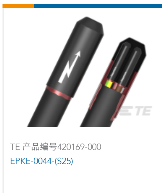
TE 产品编号420169-000 EPKE-0044-(S25)