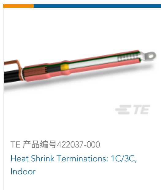
TE 产品编号422037-000 Heat Shrink Terminations: 1C/3C, Indoor