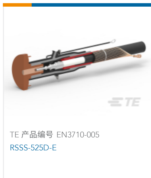
TE 产品编号 EN3710-005 RSSS-525D-E