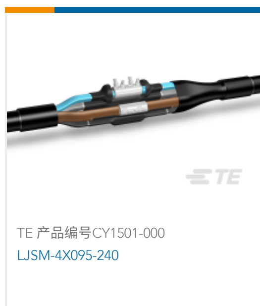
TE 产品编号CY1501-000 LJSM-4X095-240