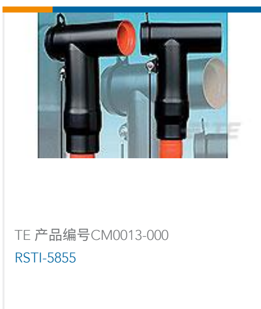
TE 产品编号CM0013-000 RSTI-5855