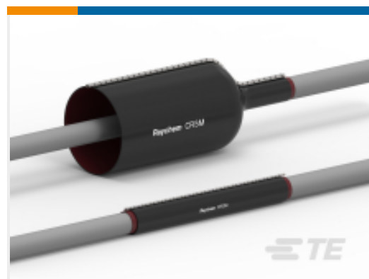
TE 产品编号985043-000 CRSM-84/20-750/239(S8)