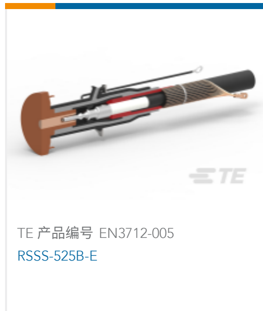
TE 产品编号 EN3712-005 RSSS-525B-E