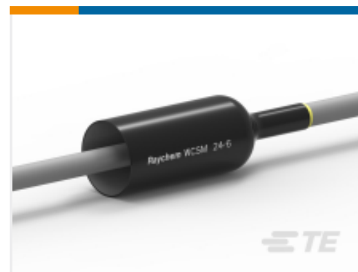
TE 产品编号CU9289-000 WCSM-24/6-1000/S(S20)