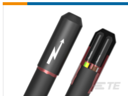
TE 产品编号D95399-000 EPKE-0024-DE02(S25)