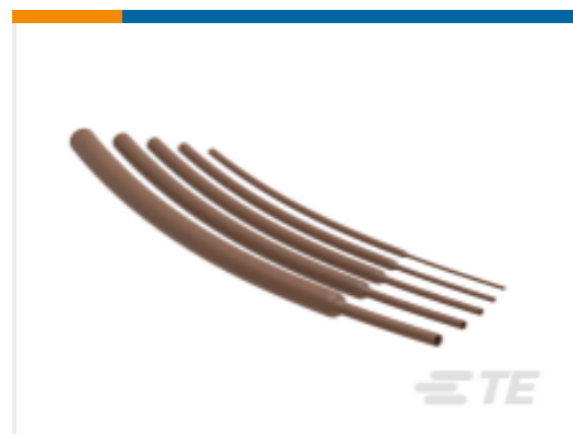
TE 产品编号5053004011 RNF-100-1 热缩管