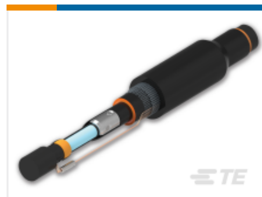
TE 产品编号407853-000 MXSU-3111