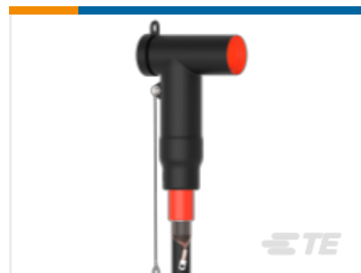
TE 产品编号CR5011-007 RSTI-6853