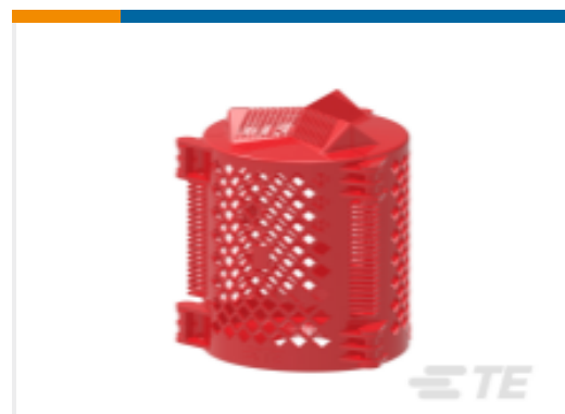
TE 产品编号BR3669-000 BCAC-IC-5D/6(B6)