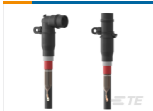
TE 产品编号 CAT-RSES-RSSS 屏蔽式可分离连接器 250A