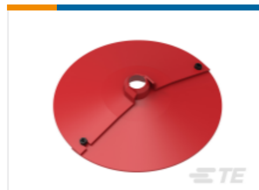
TE 产品编号E70421-000 RRGS-35/600-M(B3)