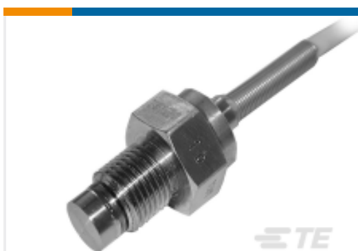
TE 产品编号EXPC1-100BS-C00002 M10X1 mV 小型压力传感器