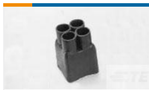
TE 产品编号034084-001 F133-200-FR