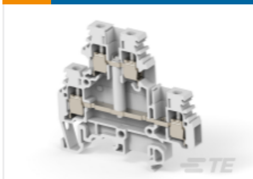
TE 产品编号1SNA115166R1100 M4/6.D1