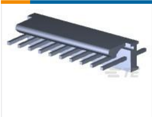
TE 产品编号1-640456-0 10P MTA100 HDR ASSY F/L SQ STR