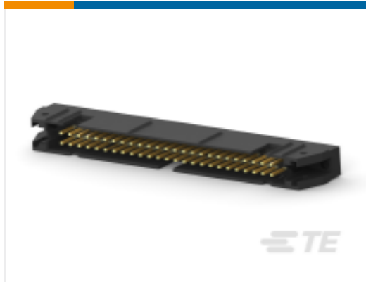
TE 产品编号5499913-6 AMP 锁门通用插头