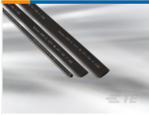
TE 产品编号EM7481-000 X2-2.0-0-SP-SM