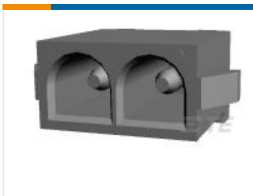
TE 产品编号350428-1 02P UMNL PIN HDR ASSY NATL