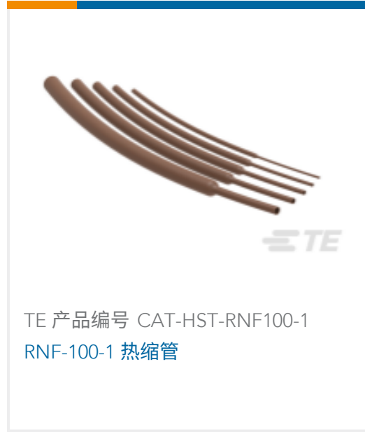
TE 产品编号 CAT-HST-RNF100-1 RNF-100-1 热缩管