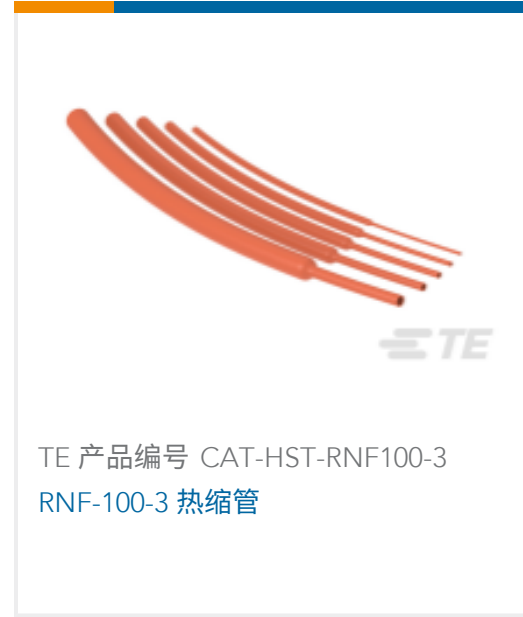
TE 产品编号 CAT-HST-RNF100-3 RNF-100-3 热缩管