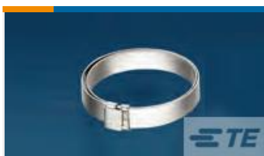
TE 产品编号 CW2823-000 R85049/128-3