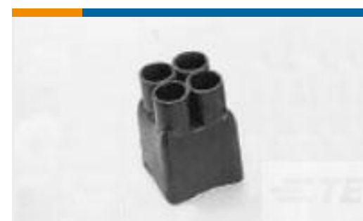
TE 产品编号034084-001 F133-200-FR