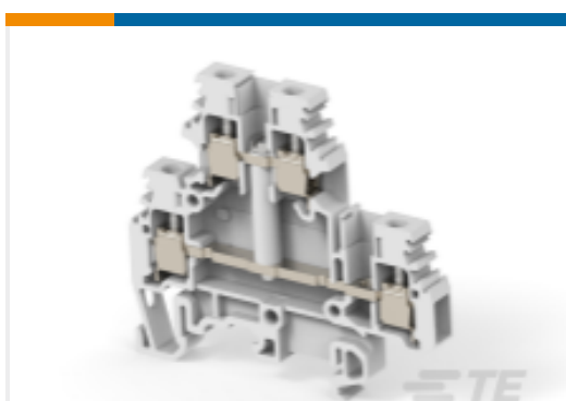
TE 产品编号1SNA115166R1100 M4/6.D1