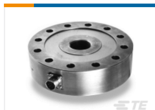
TE 产品编号EFN30-50KN-C20002 Load Cell up to 200,000 Lb, FN3000