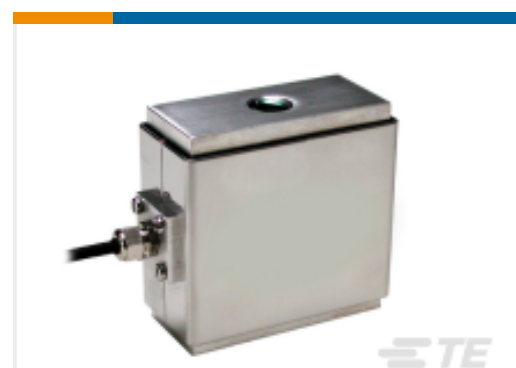
TE 产品编号EFN31-100N-C20005 FN3148-100N-/SC