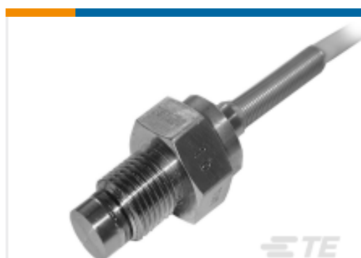
TE 产品编号EXPC1-100BS-C00002 M10X1 mV 小型压力传感器