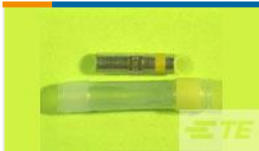
TE 产品编号 650075-000 D-436-37