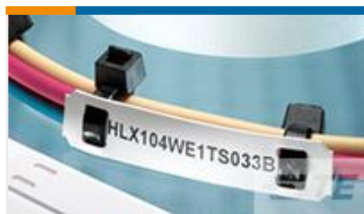
TE 产品编号EC7637-000 HLX104YW1TS050B