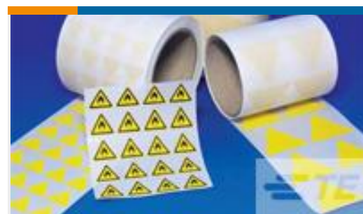
TE 产品编号4-1768018-2 EET-1325P-4