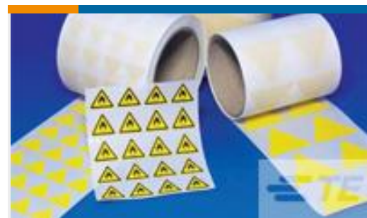
TE 产品编号4-1768018-2 EET-1325P-4