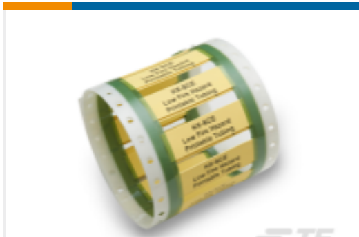
TE 产品编号F26167-000 HX-SCE Low Fire Hazard Sleeves