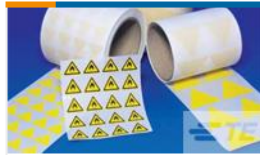
TE 产品编号4-1768018-2 EET-1325P-4