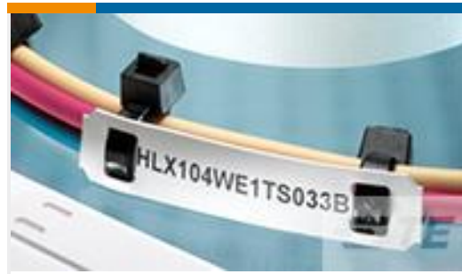
TE 产品编号EC7637-000 HLX104YW1TS050B