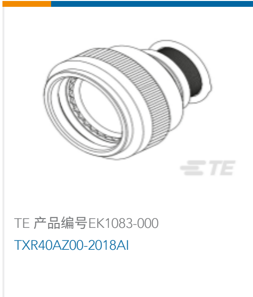
TE 产品编号EK1083-000 TXR40AZ00-2018AI