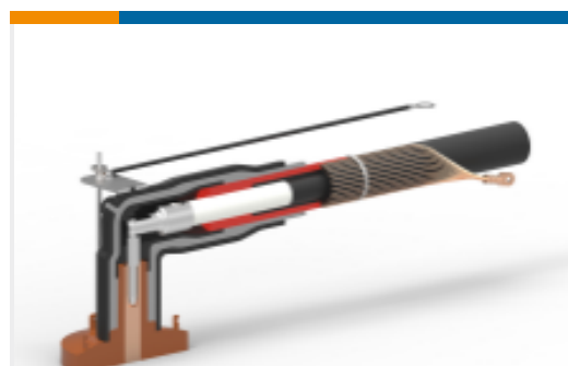
TE 产品编号EN3701-005 RSES-525D-E