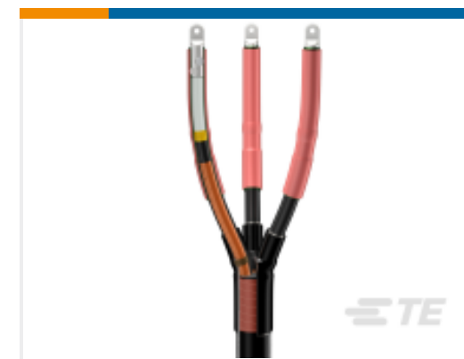
TE 产品编号E92435-063 POLT-12D/3XIH1