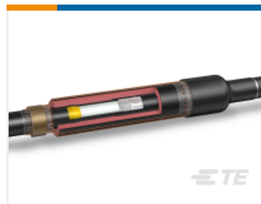
TE 产品编号E67139-069 POLJ-24/1X120-240