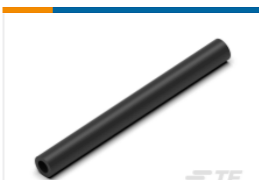
TE 产品编号CN5946-000 EN-CGAT-6/2-0-1200