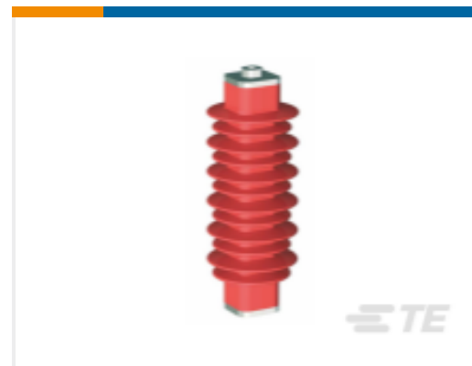
TE 产品编号EN6028-000 HDA-33M-B3-NFF