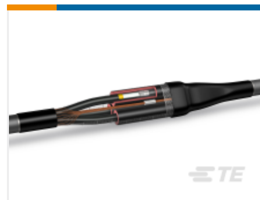
TE 产品编号D11309-070 POLJ-12/3X25-70