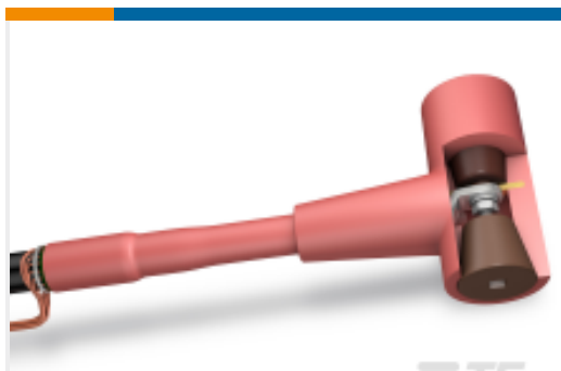
TE 产品编号555340-070 RICS-5123