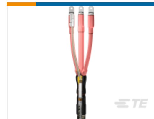
TE 产品编号A31452-070 GUST-12/70-120/800-L12