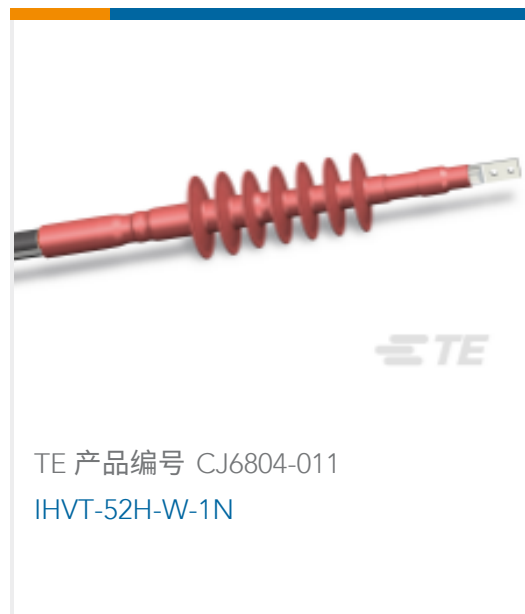
TE 产品编号 CJ6804-011 IHVT-52H-W-1N