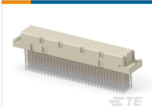
TE 产品编号254960-E STVE 160 F ABCDE VVVV 7-00 EEUE 17,0*