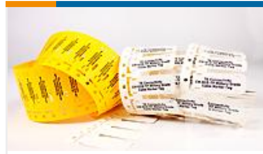
TE 产品编号A83925-000 CM-SCE-TP-1/2-6H-9