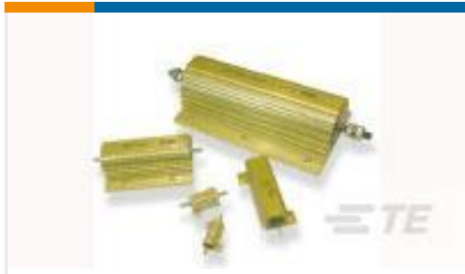
TE 产品编号2-1625971-4 HSA25 220R 5%