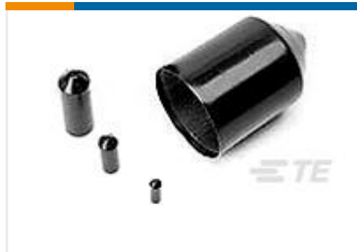
TE 产品编号174271-000 101A011-3/86-0