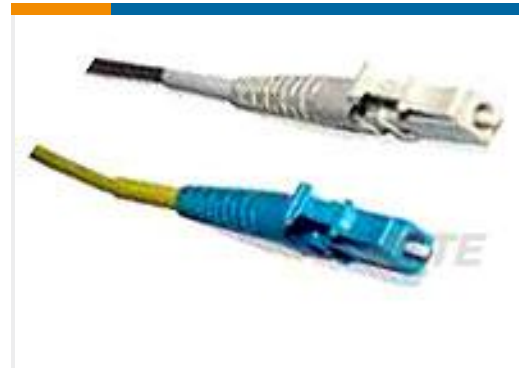
TE 产品编号6828129-2 CO KIT, LC, MM, DUP TIGHT BULK