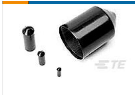
TE 产品编号662435-000 101A021-3/86-0