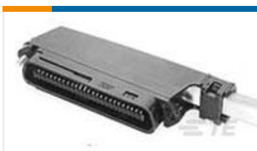
TE 产品编号3-5229913-1 KIT, RCPT, 50 POS, B SLOT