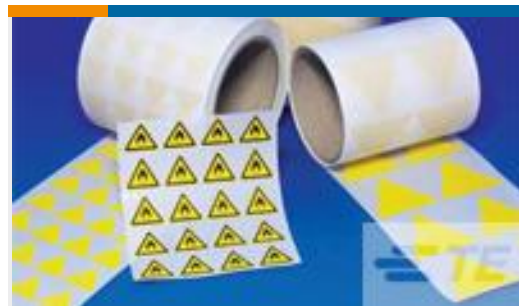
TE 产品编号4-1768018-2 EET-1325P-4