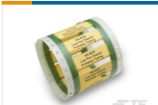
TE 产品编号F26167-000 HX-SCE Low Fire Hazard Sleeves