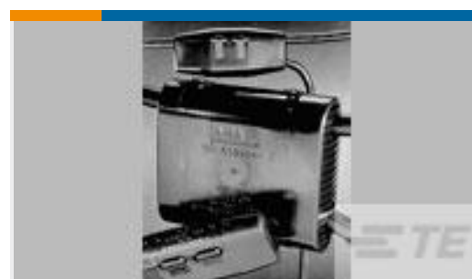
TE 产品编号83364-1 TAP COVER, TYPE II MINI WEDGE