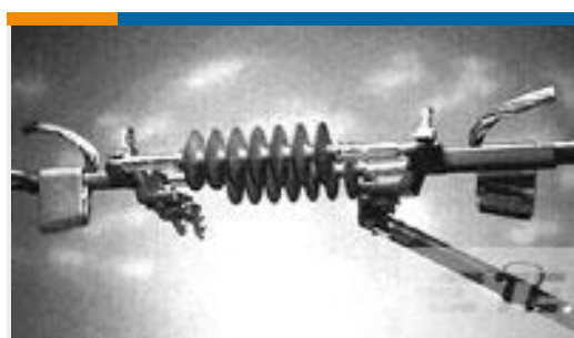
TE 产品编号83843-3 AMPACT ILD Replacement TAP 477.0