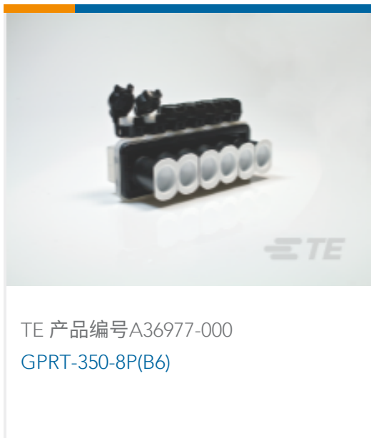
TE 产品编号A36977-000 GPRT-350-8P(B6)