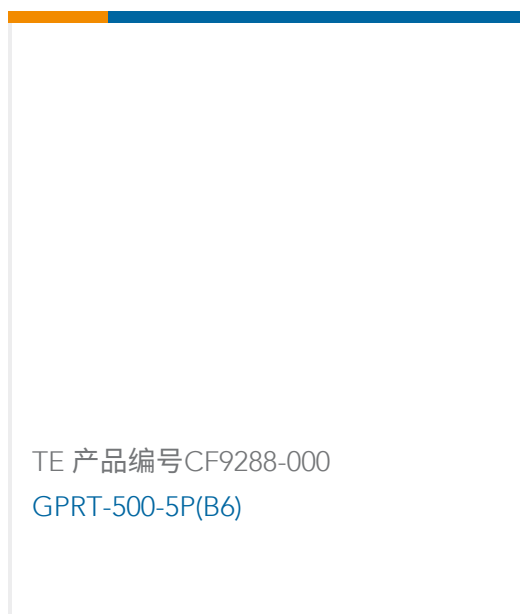
TE 产品编号CF9288-000 GPRT-500-5P(B6)