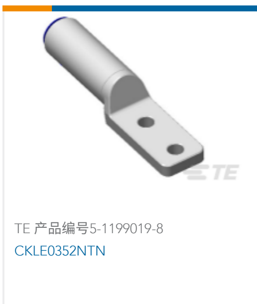
TE 产品编号5-1199019-8 CKLE0352NTN