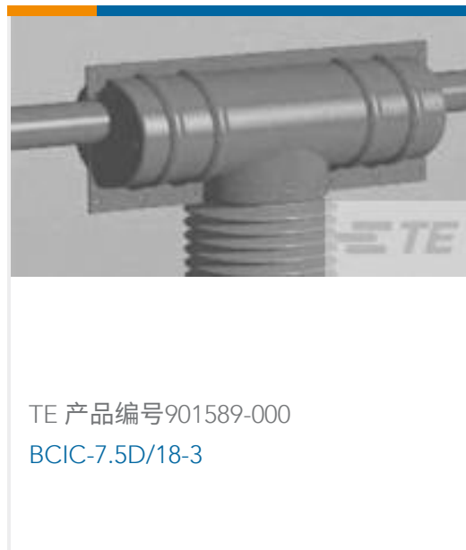
TE 产品编号901589-000 BCIC-7.5D/18-3