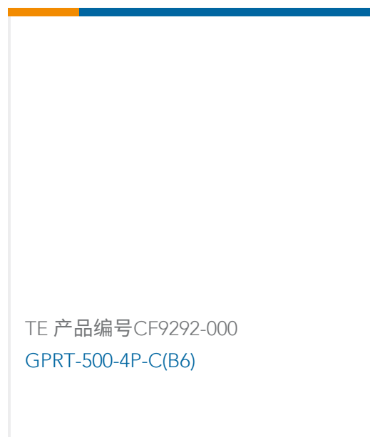
TE 产品编号CF9292-000 GPRT-500-4P-C(B6)