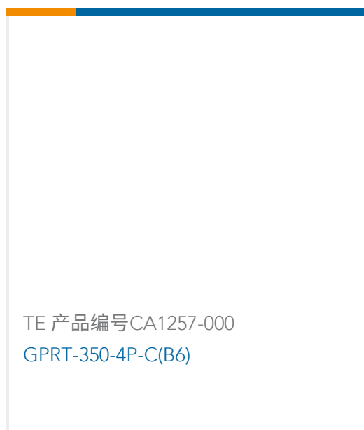
TE 产品编号CA1257-000 GPRT-350-4P-C(B6)