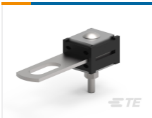
TE 产品编号705580-000 HEL-3591