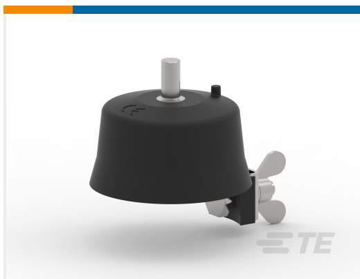
TE 产品编号D42517-000 LVA-280B-CS