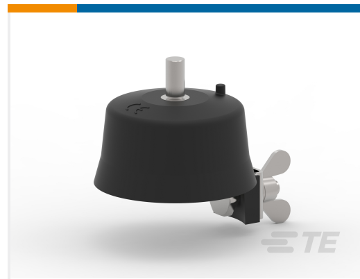
TE 产品编号D13378-000 LVA-280B-BS