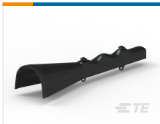
TE 产品编号CY4158-000 BCIC-TEN-01(B3)