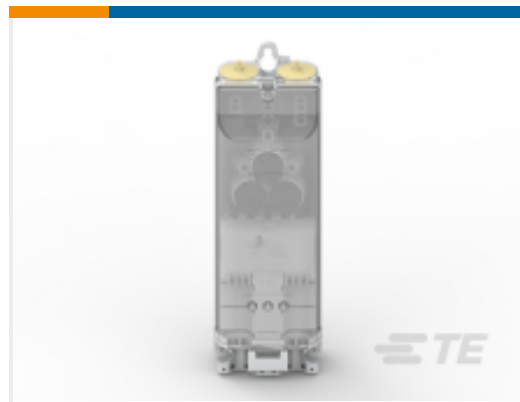
TE 产品编号669434-000 EKM-2050-3D1-5S/U-E3