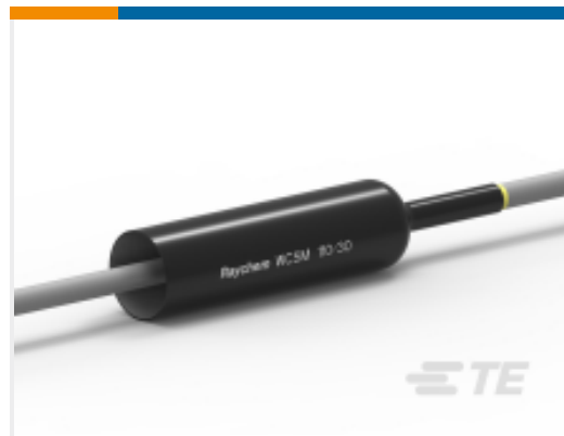
TE 产品编号CU6585-000 WCSM-110/30-1000/S(S5)