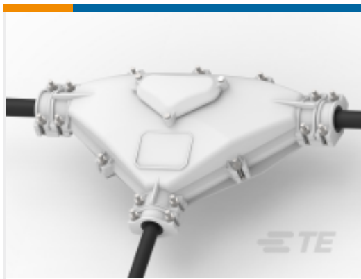
TE 产品编号407812-000 HMY-701-EM