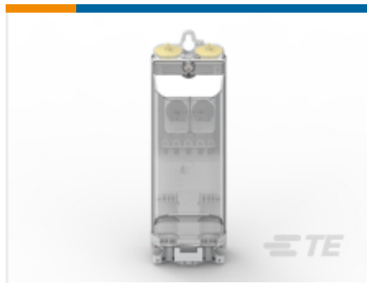
TE 产品编号543072-000 EKM-2050-2D1/FIX-5S