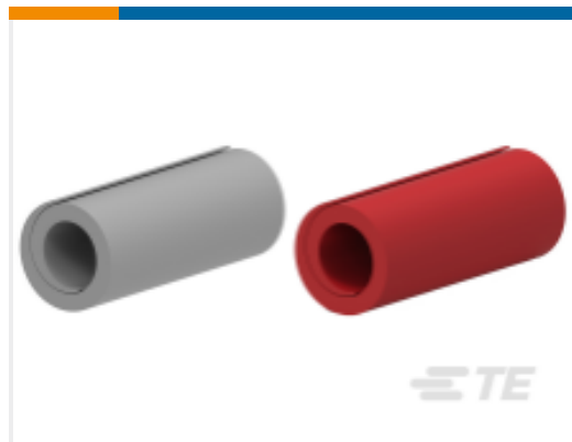
TE 产品编号BM7953-000 MVCC-10/.40(S30)