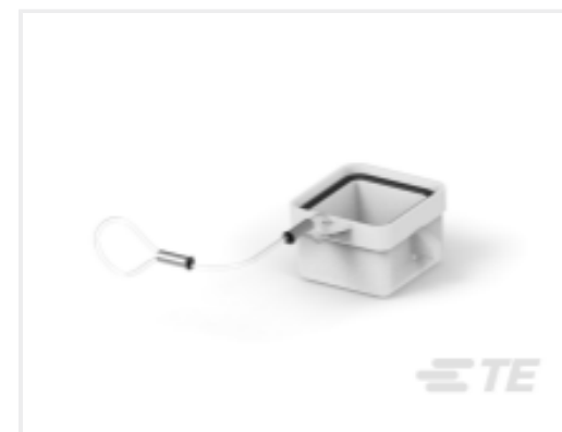
TE 产品编号T1009033100-000 H3A-KDBP