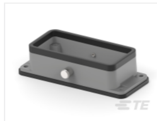
TE 产品编号T1550160000-001 H16B-AG-RC