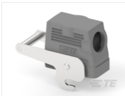
TE 产品编号T1390160132-001 H16B-TSH-RC-M32