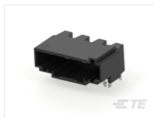
TE 产品编号CAT-D9934-A75I Header Assembly: Wire-to-Board Connector, Spring Clamp, 7.5 mm pitch, 14.5A