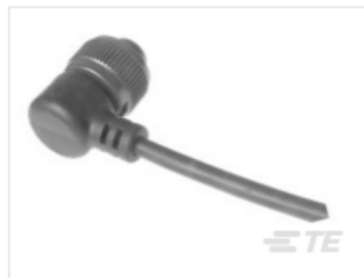
TE 产品编号318A-120 CABLE 318A