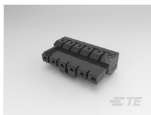
TE 产品编号1-2271454-6 D3950 REC 6POS 1ROW X KEY MARKED