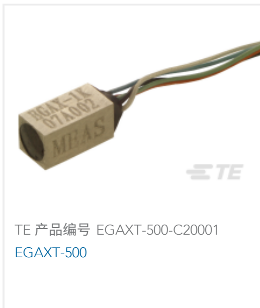
TE 产品编号 EGAXT-500-C20001 EGAXT-500