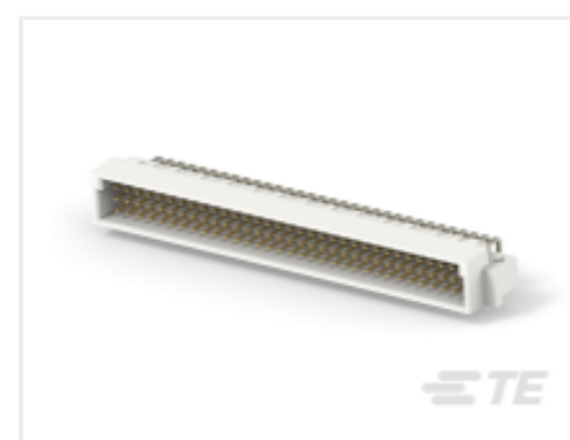
TE 产品编号6-2271013-0 CELLO,PIN,96P,TH,RA,FG,DIP4.0,-