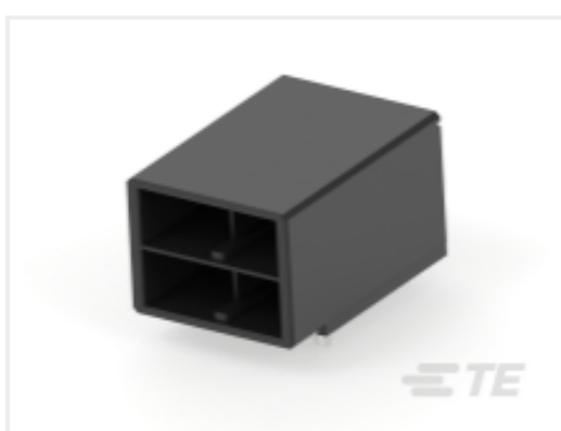
TE 产品编号CAT-D9934-A83B Header Assembly: Wire-to-Board, 20-45A, 250-630V