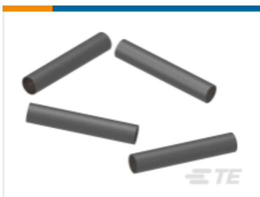
TE 产品编号2534214002 AP-2000 热缩管