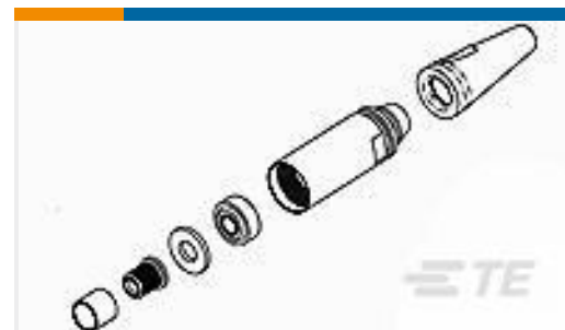
TE 产品编号1828700-1 CBL ADPT,PRO BEAM MINI PLUG 5.0 AL EPDM