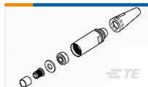
TE 产品编号1828700-1 CBL ADPT,PRO BEAM MINI PLUG 5.0 AL EPDM